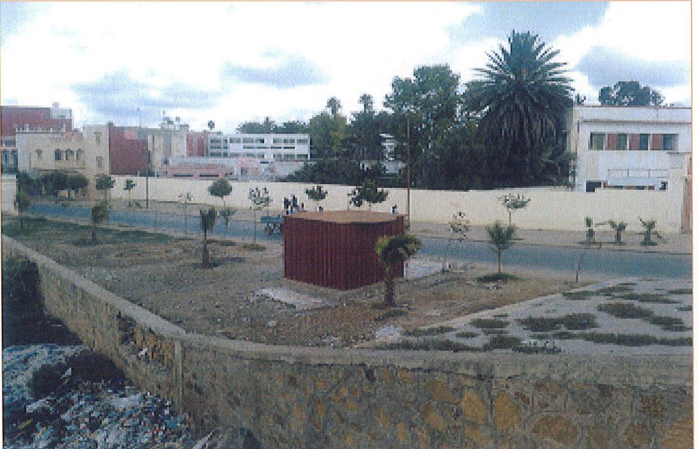
الصورة 1: تحويل إحدى النقط السوداء بجوار الثانوية المحمدية إلى ما يشبه حديقة

نبش فريق "الصحفيون الشباب من أجل البيئة" في الموضوع من خلال الاتصال المباشر ببعض من الساكنة المحلية ومن خلال إجراء لقاءات وحوارات مع بعض مسؤولي الجهات المعنية، كما قام الفريق بعدة زيارات ميدانية وخلص إلى بعض الأسباب الكامنة وراء هذه الحالة المتدهورة للحدائق كما اقترح مجموعة من الحلول لتجاوز الوضعية الراهنة.