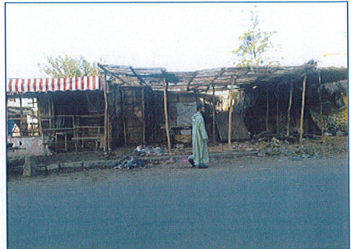
الصورة 2: حديقة لالة رقية.... أصبحت سوقا عشوانيا للخضر

ولم يسلم المتنزه الطبيعي "سيدي عيسى بن قاسم" من بطش البشر بعدما كان محجا للأسر القصرية كل يوم جمعة حيث لم يتبقى منه إلا الاسم. *